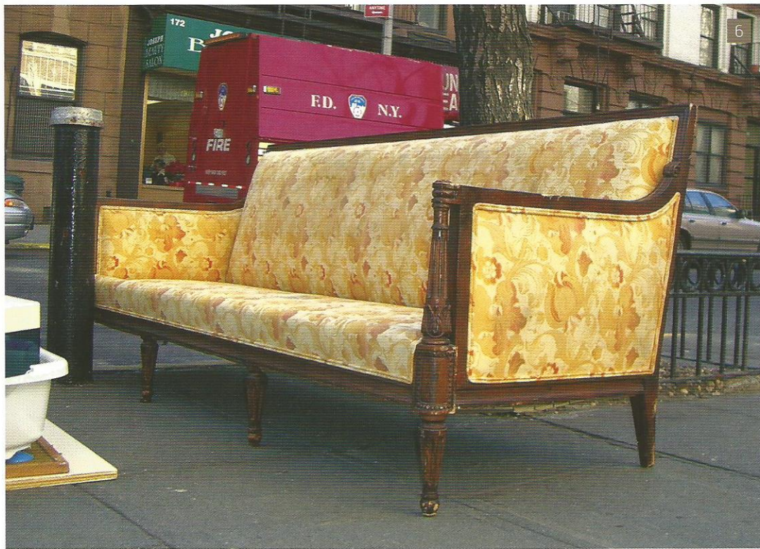
[6] Segons l'autor de la imatge, als carrers de Nova York es poden trobar veritables tresors entre mars d'escombraries.

argumentar l'impacte negatiu que, des del seu punt de vista, el consum excessiu causava a l'individu.